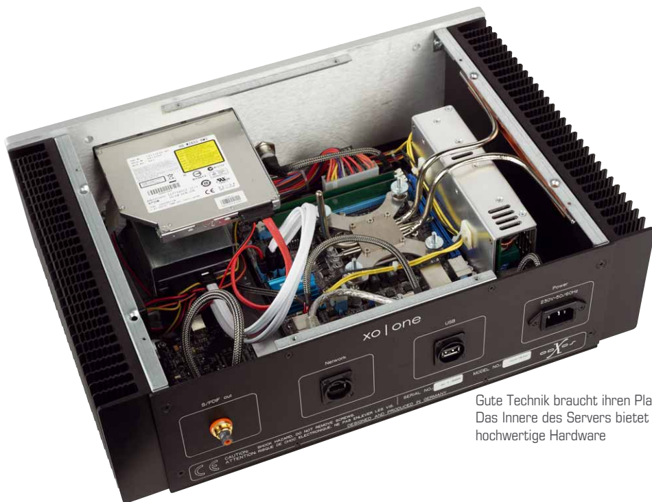
Gute Technik braucht ihren Platz: Das Innere des Servers bietet hochwertige Hardware

Wie bei jedem Gerät, auf dem man seine Musiksammlung speichert, sollte man auch beim xolone ab und zu seine Bibliothek durch ein Backup sichern, denn eine Weisheit der Datenverarbeitung besagt „Es ist keine Frage, ob eine Festplatte irgendwann versagt, sondern nur wann“. Hierfür bietet der xolone die Möglichkeit, einen externen Massenspeicher über die USB-A-Buchse anzuschließen und dort eine Kopie sämtlicher gespeicherter Titel zu hinterlegen, so dass auch im Falle eines Festplattenausfalls nicht die gesamte Digitalisierungsarbeit umsonst war. Das war es dann auch schon mit den verfügbaren Eingängen am xolone, denn die Rückseite ist ebenso minimalistisch gestaltet wie die Front des Gerätes. X-Odos verzichtet bewusst auf alles Überflüssige und begnügt sich bei ihrem Erstlingswerk mit vier Anschlüssen: Stromzufuhr, USB, Netzwerkbuchse und ein koaxialer S/PDIF-Ausgang, der für die Ausgabe der digitalen Signale an einen D/A-Wandler genutzt wird, denn der fehlt dem Multitalent leider, um vollkommen autark agieren zu können. Jeder Server beruht letzten Endes natürlich auf einem Computer, und auch