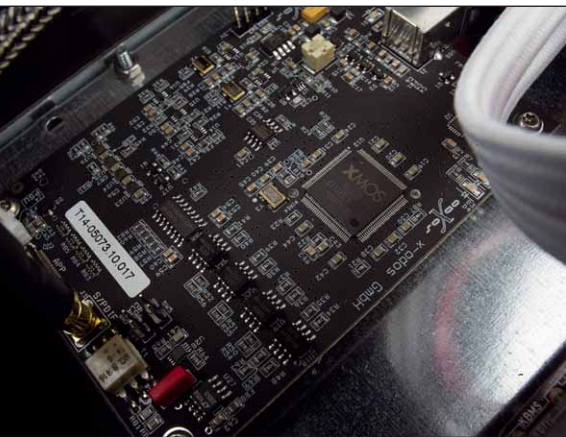
Mit dem XMOS-Chip ist einer der derzeit besten Multicontroller verbaut

der Onlineshop von HighResAudio.com, der Musik in hoher Qualität zum Download anbietet. Wer dort ein Benutzerkonto besitzt, kann den ganzen Shop durchstöbern und gekaufte Titel direkt auf der Festplatte speichern. Da der Server UpnP unterstützt, kann nicht nur er auf die komplette gespeicherte Musik zugreifen, sondern auch anderen Geräten seine Daten zur Verfügung stellen. Dadurch erfüllt er nicht nur die Funktion eines Quellgerätes, sondern auch der Einsatz als NAS ist mit dem X-Odos möglich. Der umge-